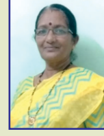
कल्पना करपे १८ एप्रिल