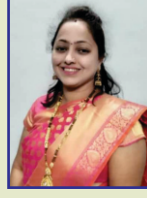
उज्वला कमोद २५ मार्च